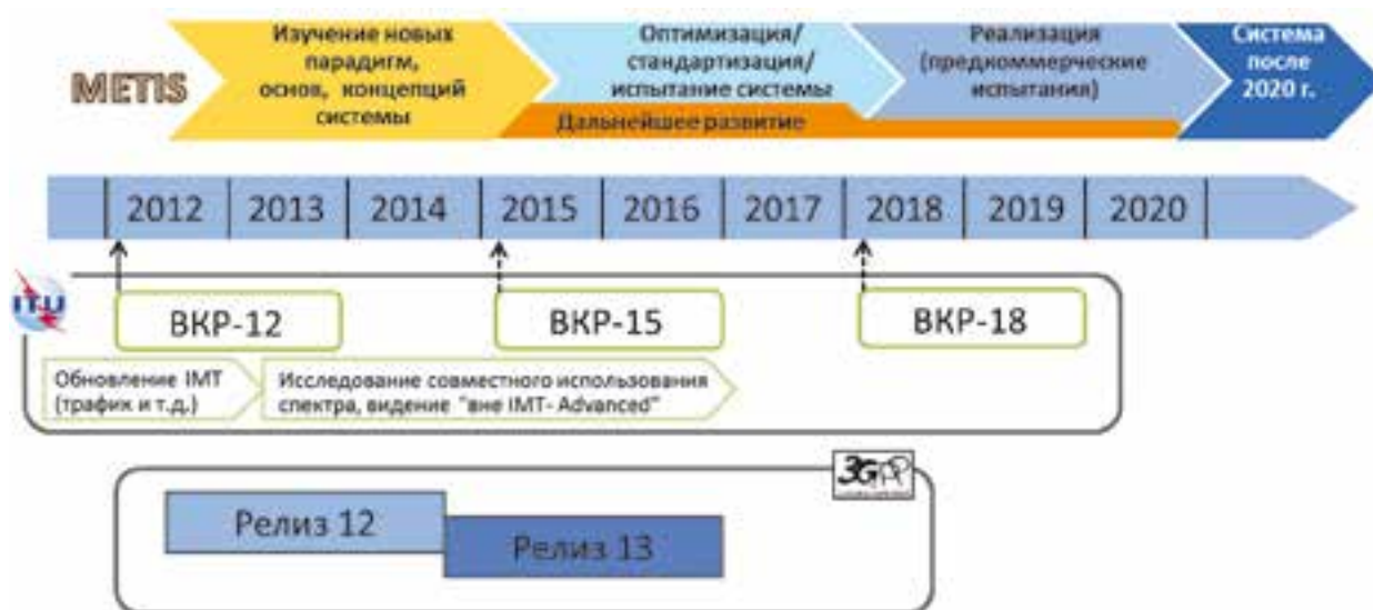
Рис. 2. Координация проекта METIS с планами МСЭ и 3GPP

расширению спектра в интересах 5G на исследовательский период до ВКР-18.