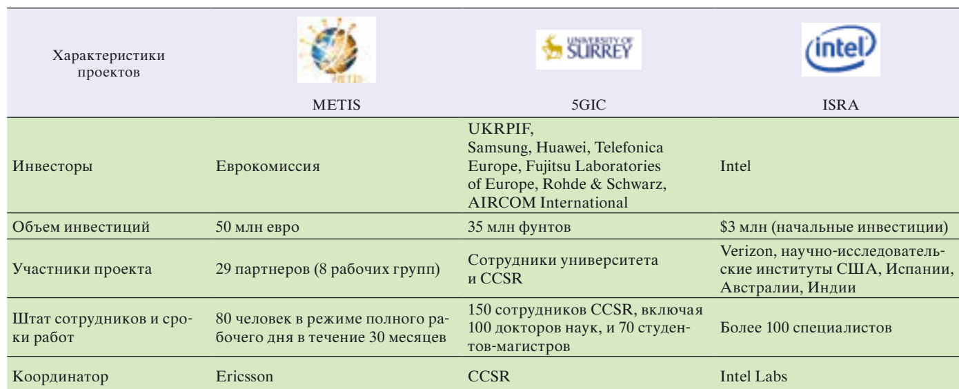
Таблица 1. Проекты развития 5G

Проект METIS. Европейская комиссия в 2012 г. анонсировала этот научно-исследовательский проект, направленный на создание мобильных и беспроводных систем связи следующего поколения (до 2020 г. и далее). Первое организационное собрание участников проекта состоялось в ноябре 2012 г. в Стокгольме. Проект реализует консорциум партнеров, в который входят пять ведущих мировых вендоров (Alcatel-Lucent, Ericsson, Huawei, Nokia, NSN), пять круп-